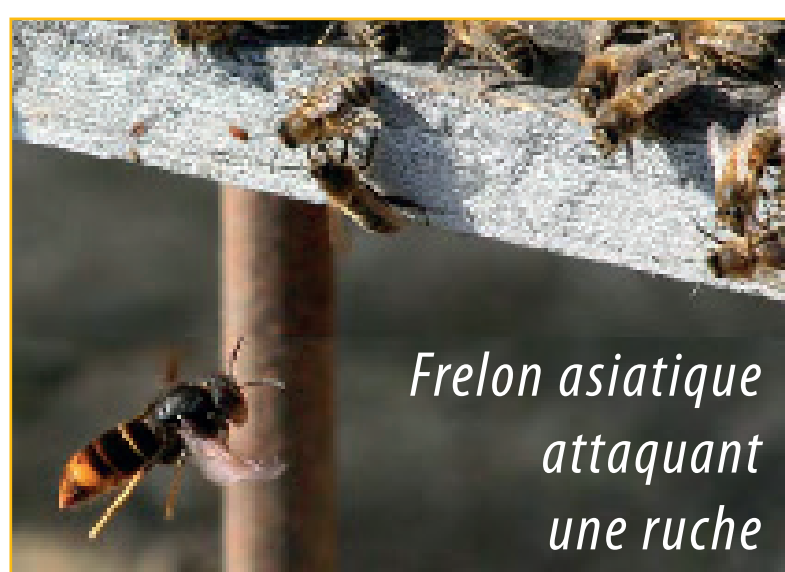
Frelon asiatique attaquant une ruche

Parallèlement, l'association reste en état de veille à l'égard de l'utilisation des pesticides sur l'île. L'agriculture en est la principale consommatrice, mais les particuliers soucieux d'avoir un jardin ou des abords « propres » ont souvent eu recours aux produits « phytosanitaires » qui participent à la pollution des terres et des points d'eau. Depuis juillet 2022, la loi Labbé (sénateur du Morbihan) interdit aux communes et aux particuliers d'utiliser des pesticides chimiques. Seuls les cotisants MSA (agriculteurs et paysagistes) peuvent à présent continuer à les utiliser.