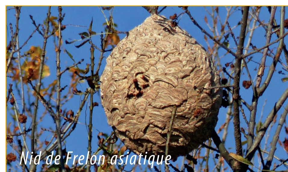
Nid de Frelon asiatique

En 2014, le premier nid de Frelons asiatiques est détruit à Locmaria. L'A.P.C.A.N.B.I. s'était préparée à cette arrivée et, soutenue par la Communauté de Communes de Belle-Ile (CCBI), s'est équipée du matériel nécessaire à la destruction des nids, notamment en hauteur, par l'acquisition d'une perche atteignant 20 m de haut permettant d'injecter du dioxyde de soufre (SO 2 ) dans les nids. L'association encourage également à piéger les reines fondatrices entre mars et mai. En 2022, les bénévoles de l'APCANBI ont détruits 70 nids de Frelons asiatiques, deux fois plus que les années précédentes.